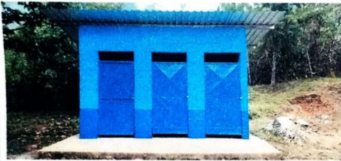
Fotografía despues de realizar los diferentes procesos de cambio de laminas troqueladas, instalacón de puertas de metal, del Baño.