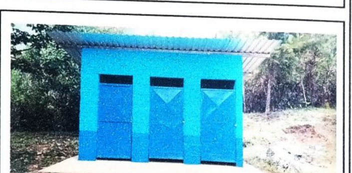
Fotografia despues de realizar los diferentes procesos de cambio de laminas troqueladas, instalacón de puertas de metal, del Baño.

Observación: Si es necesario se pueden agregar hojas adicionales y actualizar el número de hojas.