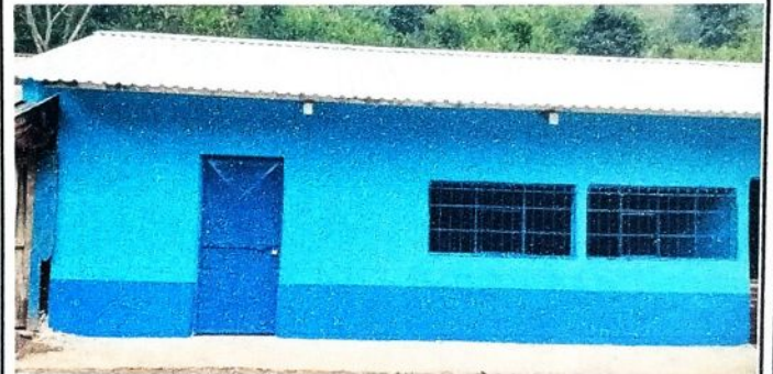
Aula No. 2: Fotografia despues de realizar los diferentes procesos de cambio de laminas troqueladas, instalacón de puertas de metal, balcones, ventanas, cambio de piso, reparacion de concreto de patio y pintado.