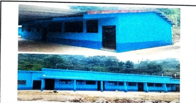
Vista panoramica de la escuela despues de la culminacion del trabajo de remozamiento.