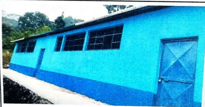
Como se muestra en la fotografia despues de realizar los diferentes procesos de cambios.