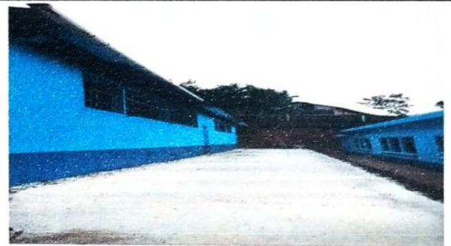
Luego de haber realizado los diferentes procesos de remodelacion de cada aula de la escuela.