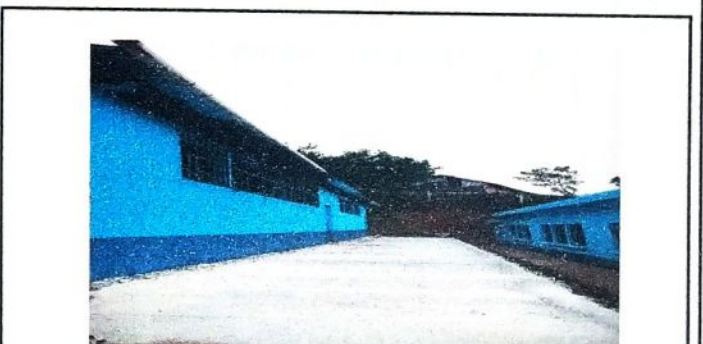
Luego de haber realizado los diferentes procesos de remodelacion de cada aula de la escuela.