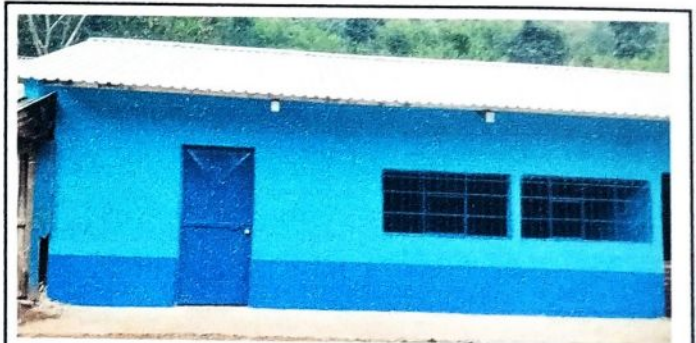
Aula No. 2: Fotografia despues de realizar los diferentes procesos de cambio de laminas troqueladas, instalacón de puertas de metal, balcones, ventanas, cambio de piso, reparacion de concreto de patio y pintado.

Observación: Si es necesario se pueden agregar hojas adicionales y actualizar el número de hojas.