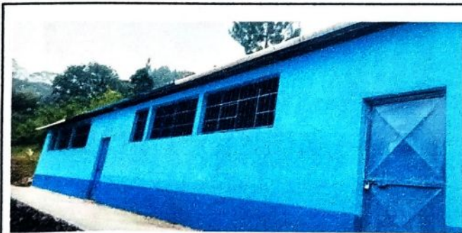
Como se muestra en la fotografia despues de realizar los diferentes procesos de cambios.