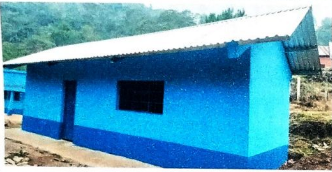
Aula No. 1: Observandose los diferentes procesos realizados en en la ecuela, cambio de laminas troqueladas, instalacón de puertas de metal, balcones y ventanas, cambio de piso, reparacion de concreto de patio