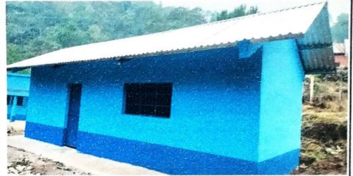
Aula No.1: Observandose los diferentes procesos realizados en la escuela, cambio de laminas troqueladas, instalacón de puertas de metal, balcones y ventanas, cambio de piso, reparacion de concreto de patio